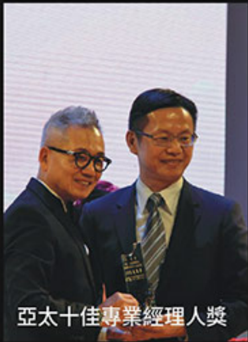
亞太十佳專業經理人獎