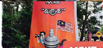
LIGHT THE NIGHT