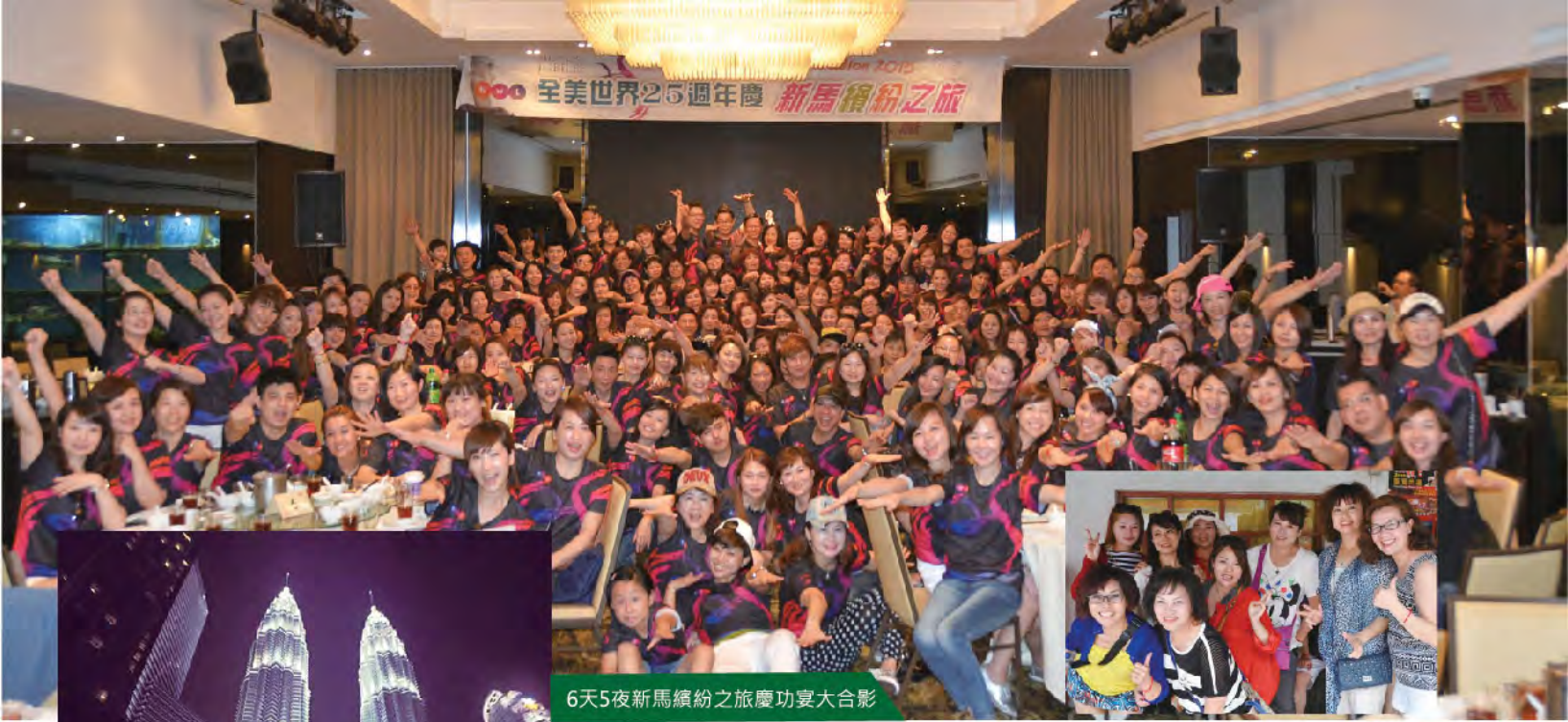
6天5夜新馬繽紛之旅慶功宴大合影