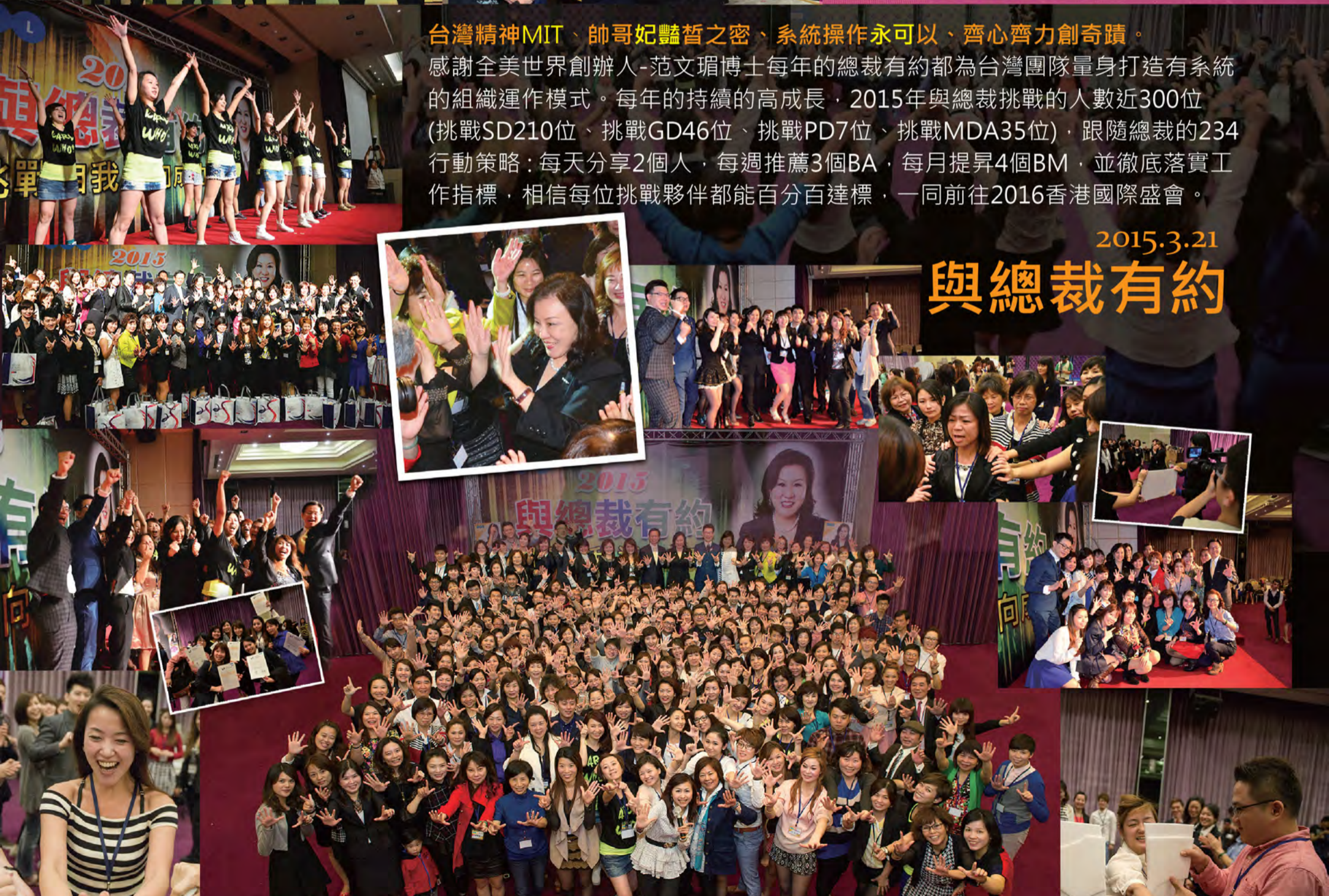
▲ 與總裁有約全體大合照