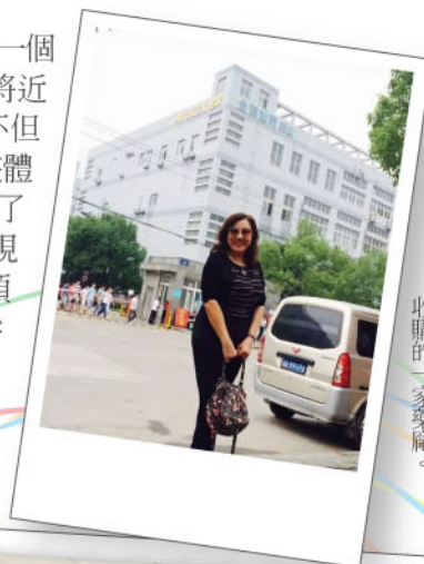
◎ 全美世界集團在中國浙江收購的一家藥廠。

10月份，台灣寫下一個新的紀錄，創下單月將近“一億元”的佳績！不但如此，累計到現在，整體比去年同期更成長了52.4%！這樣優異的表現，都要感謝所有高階領導的帶領以及全體夥伴的努力，按此進度，我絕對相信今年5億的目標一定可以達成，我們一起加油吧！