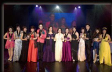
Award Presentation 頒獎典禮

30 Apr - 1 May 2015 Marina Bay Sands Singapore 新加坡濱海灣金沙