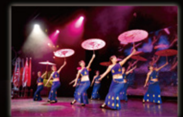
Best Worlders' Performance 才藝表演