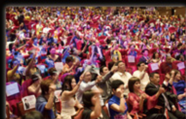
Cheering & Bonding 喝采與掌聲