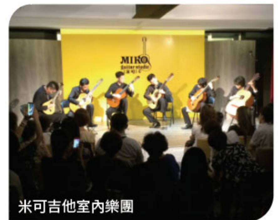
米可吉他室內樂團

聽完演奏，我留下來與團長交談，才知道他們即將前往中國大陸做巡迴演出，為了鍛鍊體力與耐力，每天利用夜晚時間到台中各個廣場做操練，結束後回教室再彈到凌晨3點。我深深地被這一群流著汗水，散發光芒的年輕人所吸引，當下就邀請他們在10週年慶的青年創業論壇中擔任激勵演講及表演的嘉賓，期望他們的故事能帶給現場的創業青年更多的啟發。