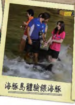
海豚島體驗餵海豚