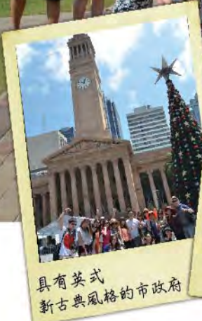
具有英式新古典風格的市政府