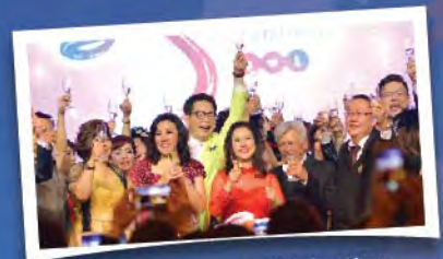
BWL Anniversary Celebration 全美世界週年慶