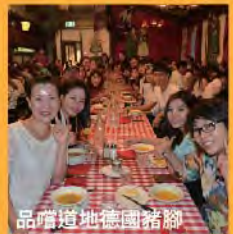
品嚐道地德國豬腳