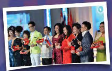
Award Presentation 頒獎典禮