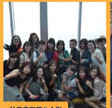
於天鼎瞭望台合影