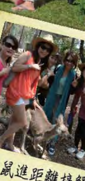
與袋鼠進距離接觸

每次與全美世界出遊，都是充滿回憶的旅程，而這次，我們在澳洲黃金海岸 - 布里斯本。十小時的航程，欣喜若狂到了目的地，馬上感受到澳洲帶給大家的見面禮，有別於台灣的寒冷，它用炙熱的天氣熱情的歡迎我們，而我們也帶著全美世界一貫的熱情，熱烈的回應它，於是我們展開了精采豐富的澳洲行。