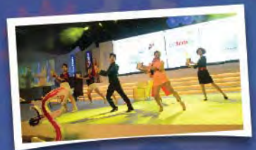
Best Worlders' Performance 才藝表演